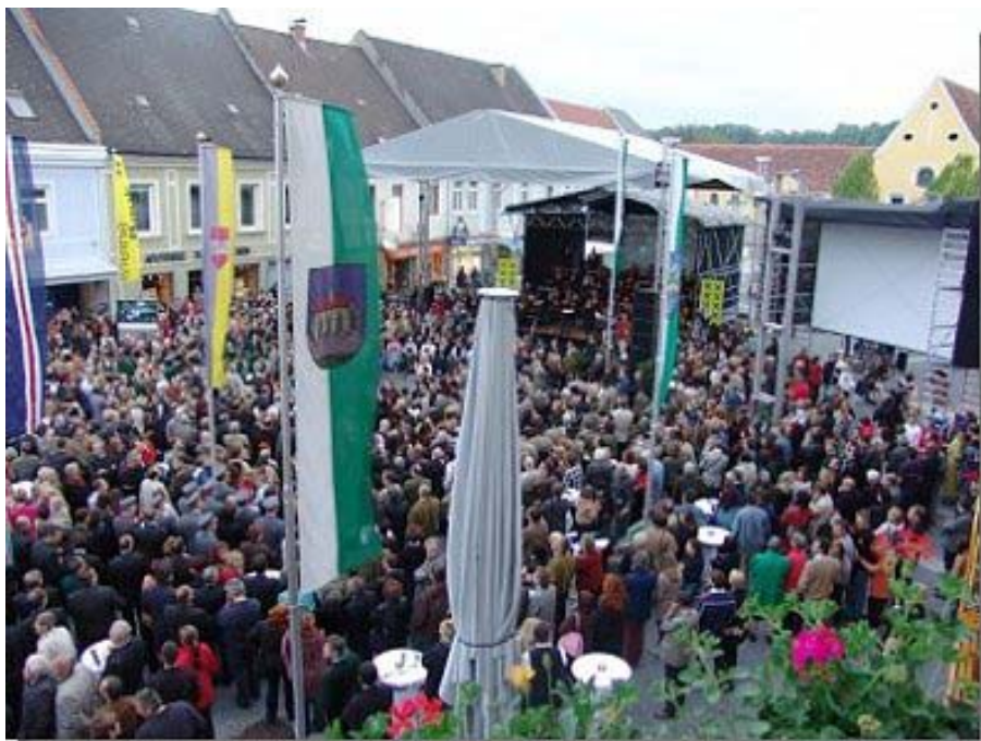
Große Eröffnung der Landesausstellung 2004 am neu errichteten Leibnitzer Hauptplatz.